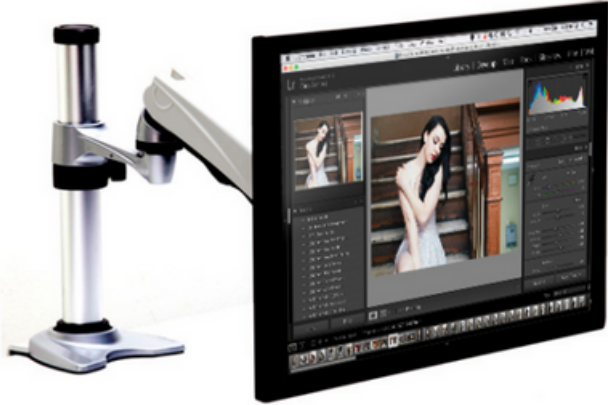
Single Monitor Arm ET-ARM S2