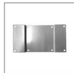
200 x 100 VESAブラケット