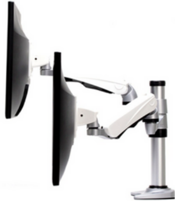
Dual Monitor Arm ET-ARM S3