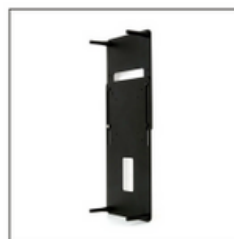
VESA無モニタ用ホルダ